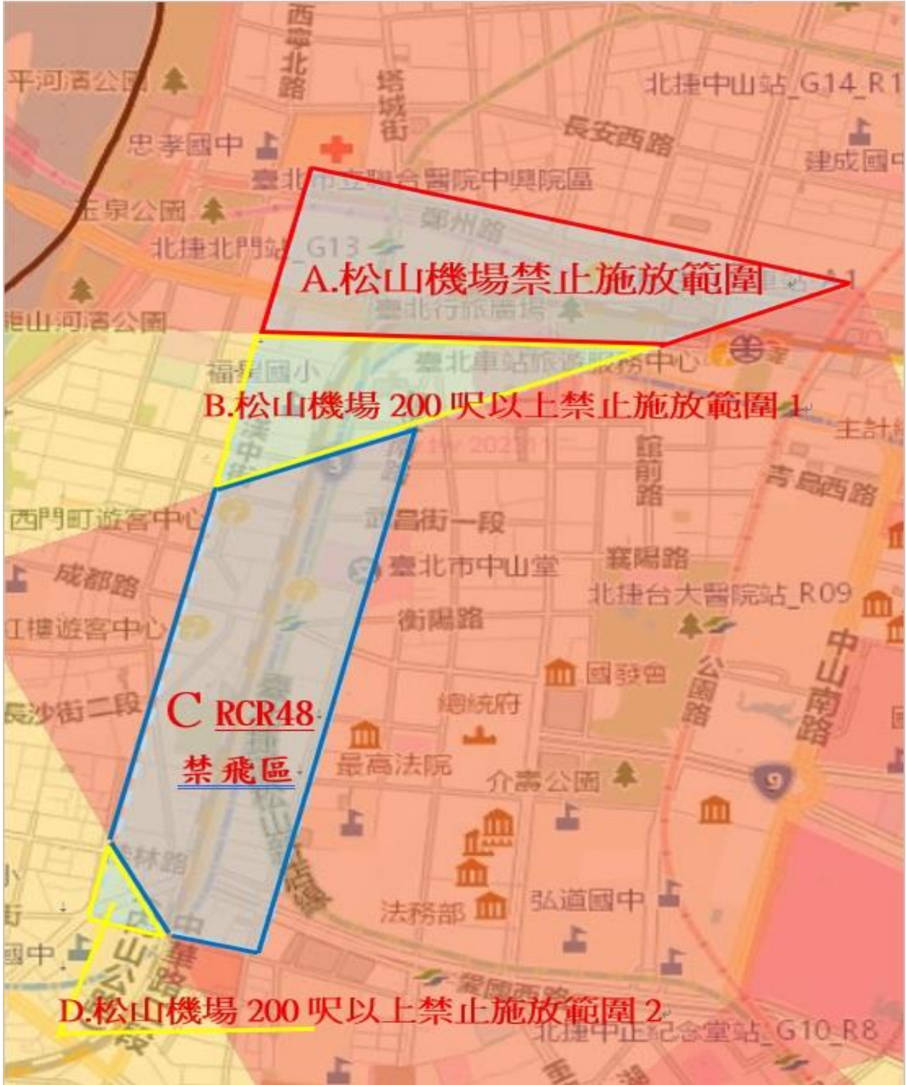
2024 台北燈節禁航區示意圖(地圖)