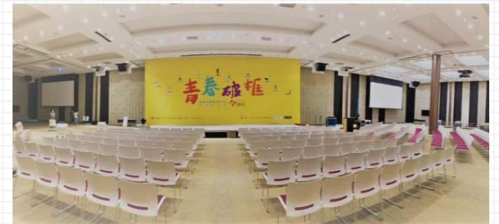
華南銀行總行2樓空景照

除原有簡報、QA 提問外，並增加論壇互動度的活動設計，邀請台東海端鄉布農高中生開場表演「八部合音」、現場手拿板標語由學生提出、形象牆影片拍攝與公民素養學堂。