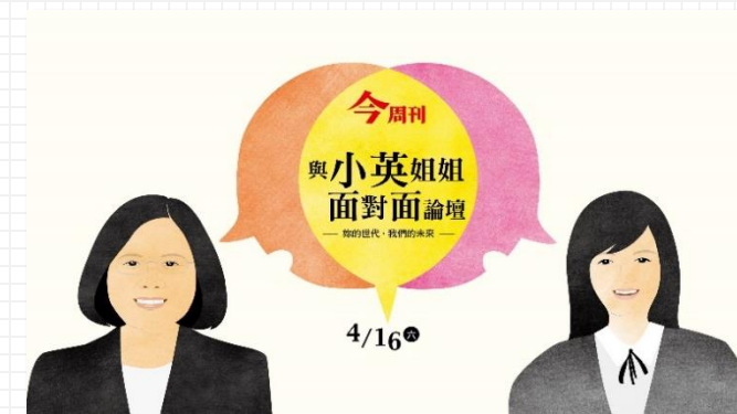
2016 妳的世代 我們的未來