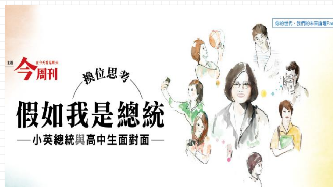
2017 換為思考 假如我是總統