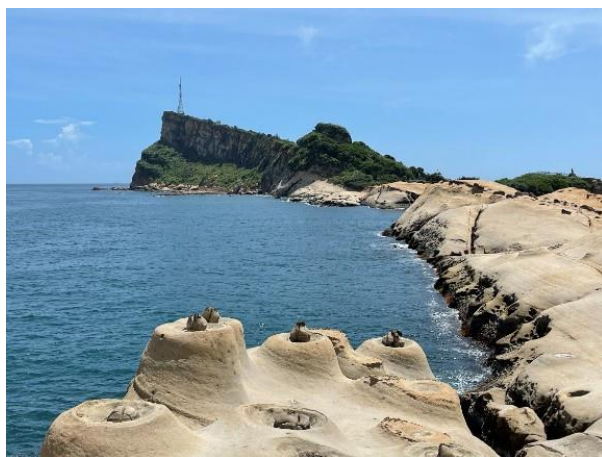
圖 1 台灣地景保育網任選一張地景的照片或自行拍攝或選用照片(請務必註明出處)