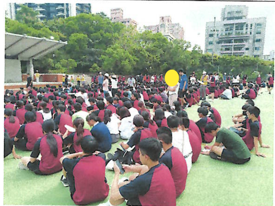
演習時發下「家庭防災卡」供學生填寫