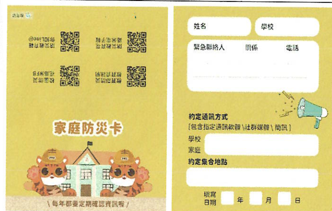
本校「家庭防災卡」樣式