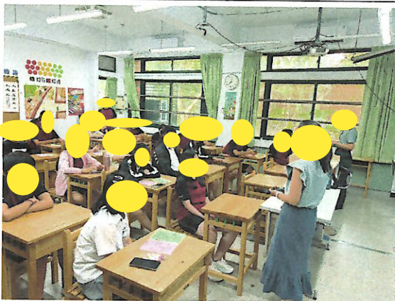
幹部訓練防災卡及紅綠單使用說明